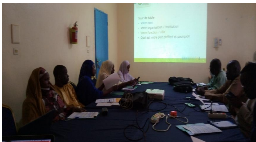
Image des séances de formation

Les participants ont été également éduqués sur les mesures et les combinaisons de ces derniers, les indices. Les mesures des carences en micronutriments directes et indirectes sont abordées.