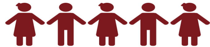
Réseau des parlementaires du Mouvement SUN-