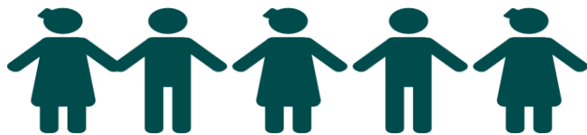
Réseau des donateurs du Mouvement SUN