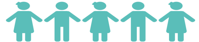
Réseau du secteur privé du Mouvement SUN